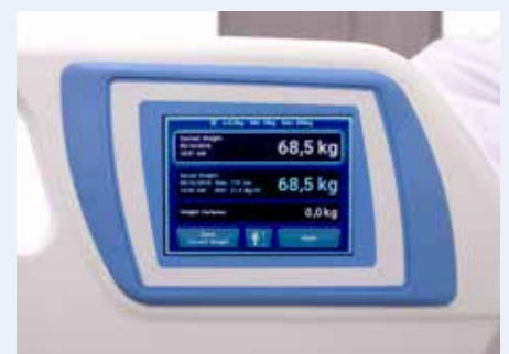
Báscula integrada de sencillo manejo

Opción de rayos X integrada , a través de la selección de superficies terapéuticas de Hill-Rom y en el accesorio integrado en el chasis