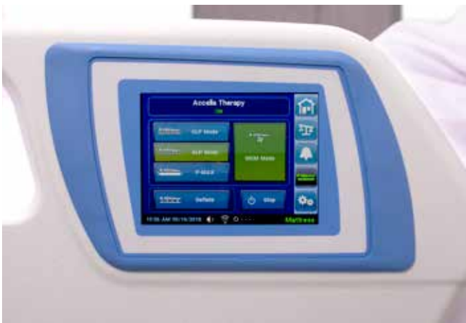
Controles de la superficie integrada Accella Therapy™