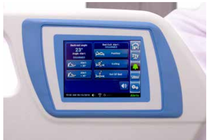
Alarma de salida de cama de tres modos