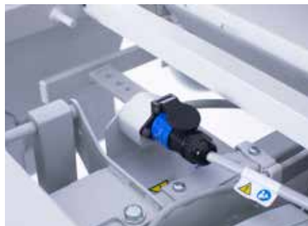
Una única conexión con el chasis para conectar fácilmente la superficie Accella Therapy a la cama