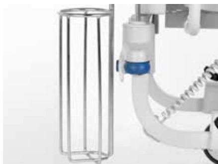
Soporte para bombona de oxígeno