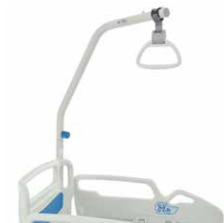
Soporte de trapecio (gris claro)