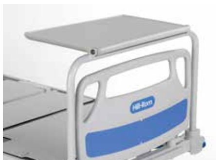
Bandeja de monitor*