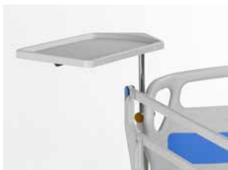
Bandeja para jeringas