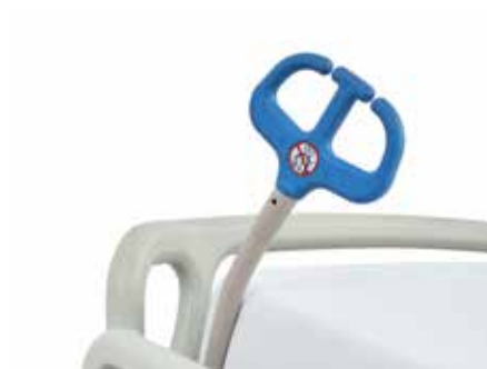
Organizador de vías