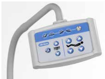
Mando en brazo flexible*