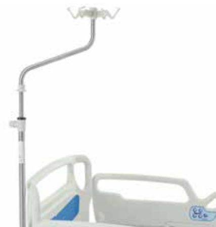
Barra portasueros recta de altura fija, der 4 ganchos