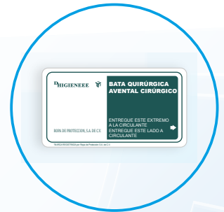
Tarjeta de transferencia