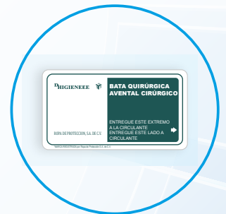
Tarjeta de transferencia