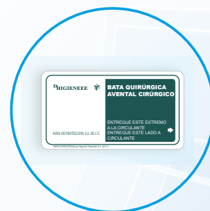
Tarjeta de transferencia