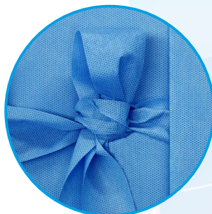
Cintas de amarre