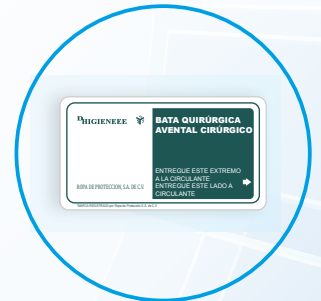
Tarjeta de transferencia