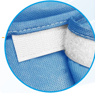
Cierre en cuello mediante velcro